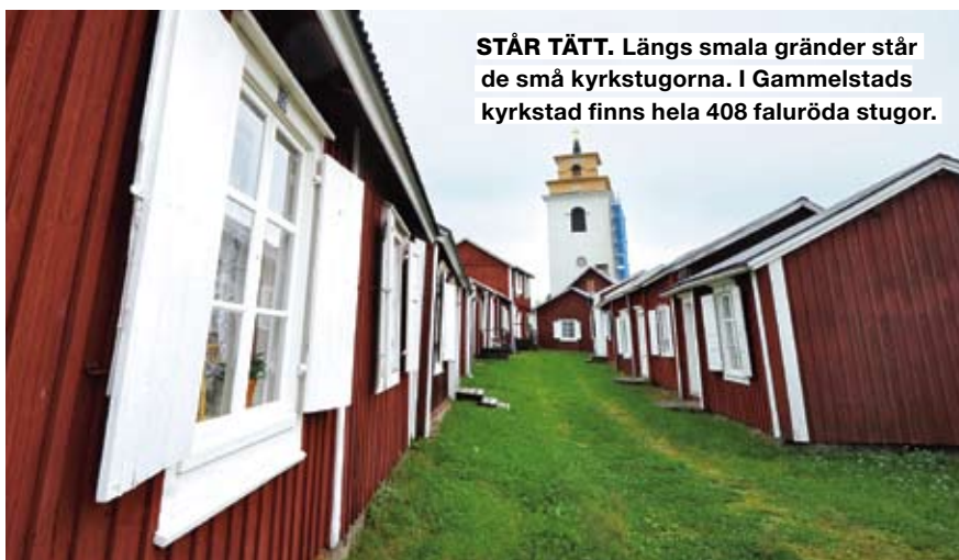
STÅR TÄTT. Längs smala gränder står de små kyrkstugorna. I Gammelstads kyrkstad finns hela 408 faluröda stugor.