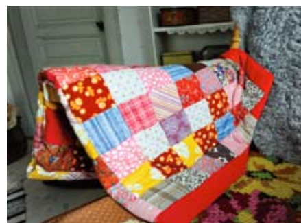
VARMT OCH GOTT. Lapptäcket och lammskinnet kommer väl till pass under kalla höstkvällar.